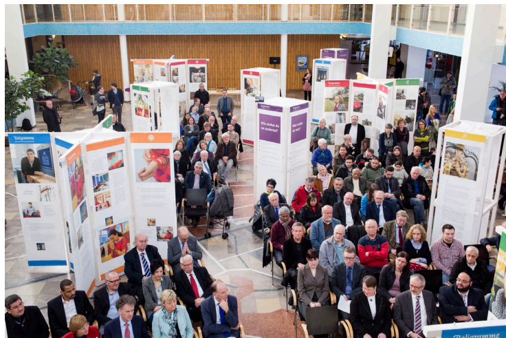
Ausstellungseröffnung in Wolfsburg am 18.01.2016